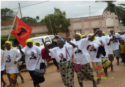
Grande saudação da população a delegação da ENE-E.P.